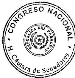
Roberto Acevedo Quevedo Presidente H. Cámara de Senadores